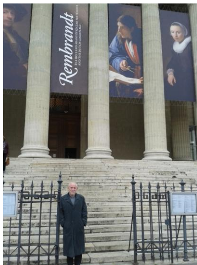
Rembrandt és a holland arany évszázad festészete

2014. 11. 12. szerda Szépművészeti Múzeum